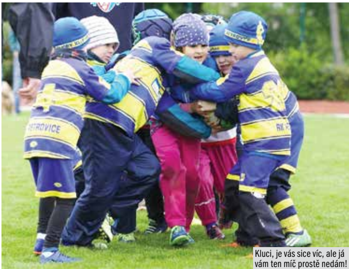
Kluci, je vás sice víc, ale já vám ten míč prostě nedám!

Petrovice, Tatra Smíchov, Sparta. Podíváte-li se na výsledky turnajů nejvyšší ženské soutěže v olympijském sedmičkovém ragby v posledních zhruba pěti letech, můžete si být celkem jisti, že vítězem byl někdo z uvedené trojice. Tyto stojaté vody ale letos, možná i k překvapení soupeřek, rozvířily hráčky Říčan. A to je česká elitní soutěž od letošního roku posílena o mistryně Rakouska z RU Donau Wien a mistryně Maďar-