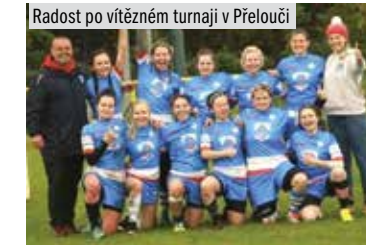
Radost po vítězném turnaji v Přelouči