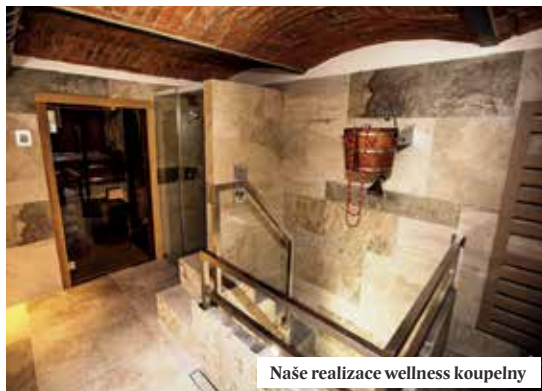
Naše realizace wellness koupelny

Koupelnové studio ČERO Kutnohorská 368, Louňovice Bližší informace na www.cero.cz tel.: 311 240 850, 739 627 840 Otevírací doba: PO-PÁ 8-18, SO 9-13