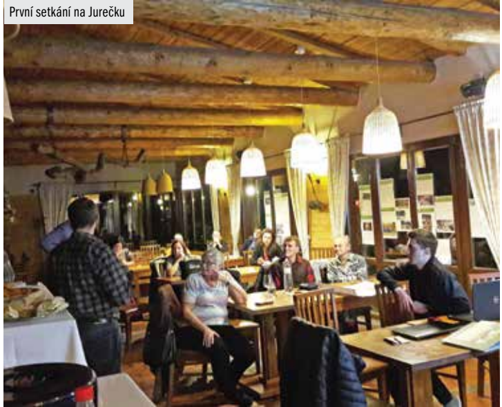
První setkání na Jurečku

to podmínka účasti v hlasování. Náměty ale nezapadnou. Spektrum nápadu je velmi široké od bezpečného pohybu přes zdravý životní styl až k zadržování vody v krajině či výsadbě květnatých luk a vysazování stromů. Lidé navrhli i projekty zaměřené na vzdělávání o historii města a jeho osobnostech, dopravní výchovu, omezení plastů nebo na kurzy první pomoci. Posuzování projektů by mělo trvat do konce dubna, poté budou mít navrhovatelé čas pro vlastní kampaň a v červnu se bude hlasovat. Již teď se neváhejte registrovat na www.ridimricany.cz pro pohodlné