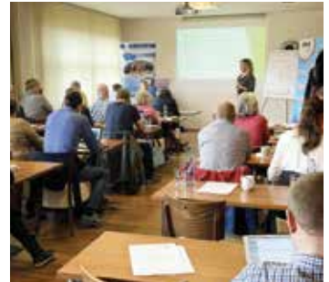
Společné setkání obcí MAS, Ladova kraje a MAP

● Společné setkání obcí území MAS Říčansko, Ladova kraje a MAPu proběhlo 14. - 15. února v příjemných prostorách S-centra v Benešově. Jsme rádi, že si udělal čas a setkání zahájil senátor Zdeněk Hřaba a nastínil možnosti vzájemné spolupráce s obcemi. Zároveň nabídl osobní účast na jednotlivých zastupitelstvech a společné řešení problémových oblastí. Pro zástupce obcí byly dále připraveny vzdělávací semináře, které zajistil SMO. Tato společná setkání jsou přínosná nejen pro nás organizátory, ale především pro aktivní starosty a zástupce, kteří se chtějí učit novým věcem a zároveň se s námi potkávat.