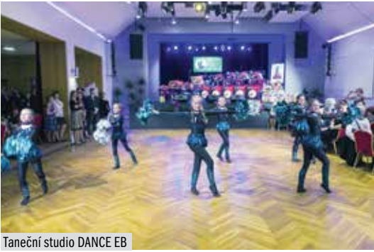
Taneční studio DANCE EB