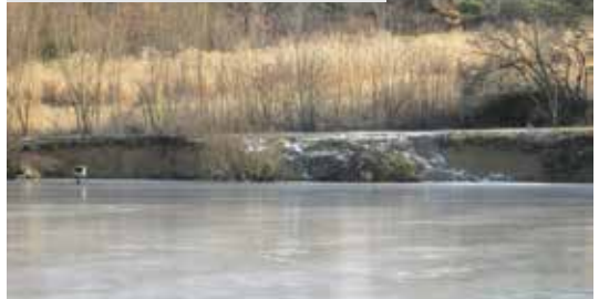
Rozpakov - pohled na erodované břehy rybníka

Ze dna rybníka je třeba odtěžit naplavený sediment. Předpokládaná částka na realizaci je deset milionů korun.