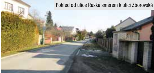
Pohled od ulice Ruská směrem k ulici Zborovská

Kateřina Lauzerová, tisková zpráva města