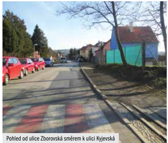
Pohled od ulice Zborovská směrem k ulici Kyjevská