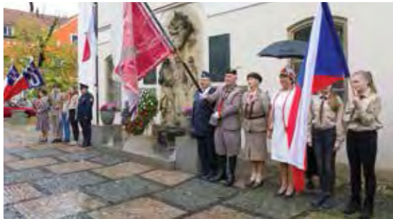
U pomníků padlých legionářů se sešli všichni, kteří se chtěli poklonit jejich památce a zároveň oslavit 100 let republiky. Cestnou stráž tvořili zástupci T.J. Sokola Říčany a Radošovice, Sboru dobrovolných hasičů a Skautského střediska Lípa Říčany.