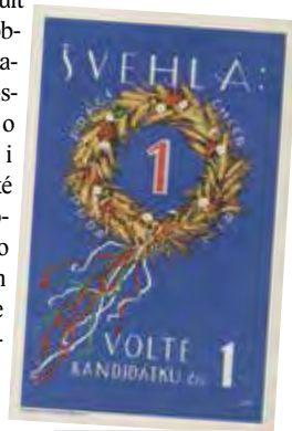
Volební plakát A. Švehly ze sbírek Muzea Říčany