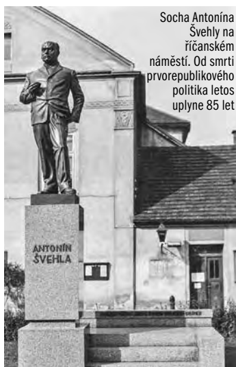
Socha Antonína Švehly na říčanském náměstí. Od smrti prvorepublikového politika letos uplyne 85 let

Švehlovým zájmem byl i tisk, redigoval Obranu zemědělců a jeho zásluhou byl založen deník Venkov, agrárnícké listy Cep nebo obrázkový časopis Rozkvět. Později založil vlastní zemědělskou tiskárnu. Aktivně se účastnil bojů drobnějších zemědělců proti zemědělským kartelům, zvláště v oblasti pěstování řepy. Byli to právě říčanští řepaři, kteří podnikli širokou veřejnost k tomu, aby Švehla zastupoval říčanský okres v rakouském parlamentu. Stalo se tak roku 1908. V následujícím roce postoupil do čela Republikánské strany zemědělského a malorolnického lidu, jejíž členové