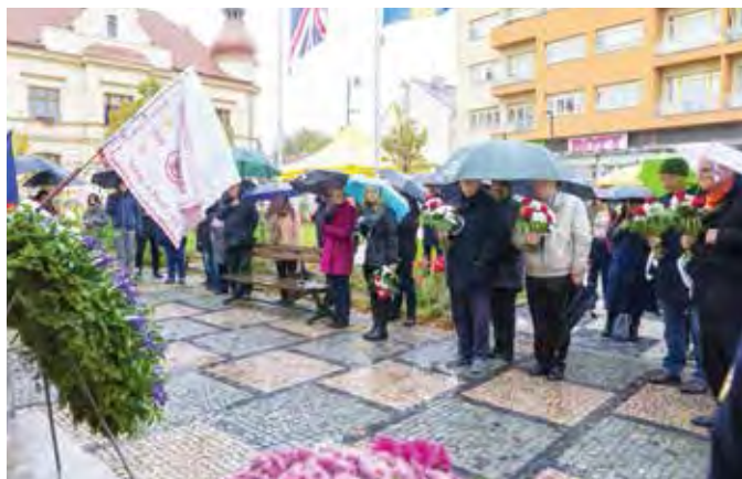
Pietní akt se konal za vydatného deště. U pomníku vlála česká vlajka, vlajky „Sokolů“ i partnerských měst.