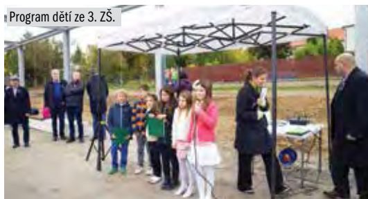
Program dětí ze 3. ZŠ.