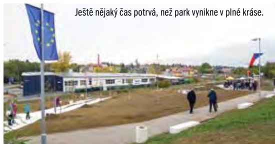
Ještě nějaký čas potrvá, než park vynikne v plné kráse.