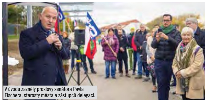
V úvodu zazněly proslovy senátora Pavla Fischera, starosty města a zástupců delegací.