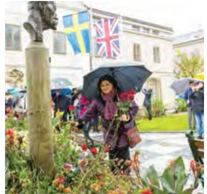
K pomníku padlých i k bustě Tomáše Garrigue Masaryka položili všichni přítomní symbolicky 100 růží, za každý rok trvání republiky jeden květ.