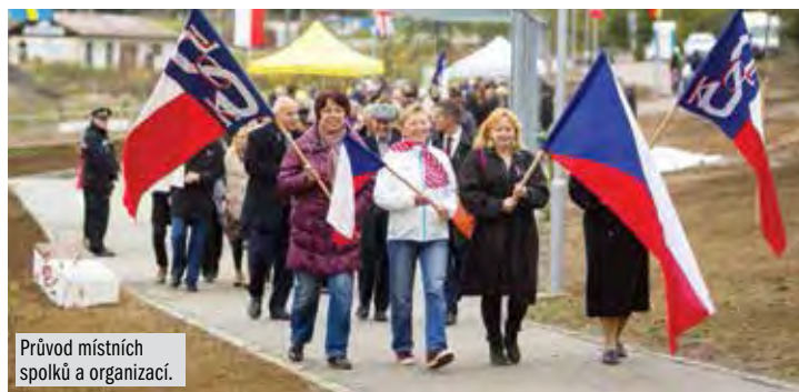
Průvod místních spolků a organizací.