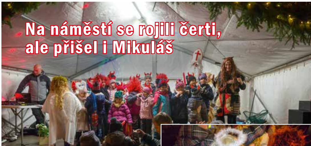
Na pódiu se objevilo víc čertů než v samotném pekle.

Město Říčany navázalo na oblíbenou tradiční čertovskou akci. Původní organizátor ji z technických důvodů nemohl realizovat. Pekelné mocnosti i nebeské bytosti zaplnily náměstí a užily si veselý večer jako obvykle.