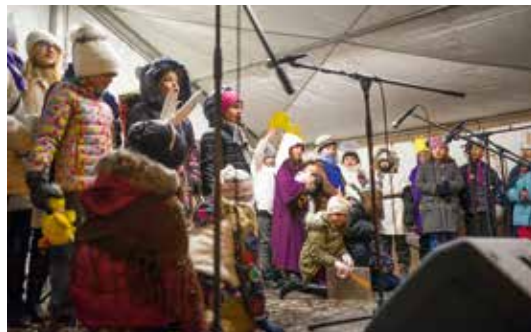
Druhý advent organizovali společně Římskokatolická farnost a Junák – český skaut středisko Lípa.