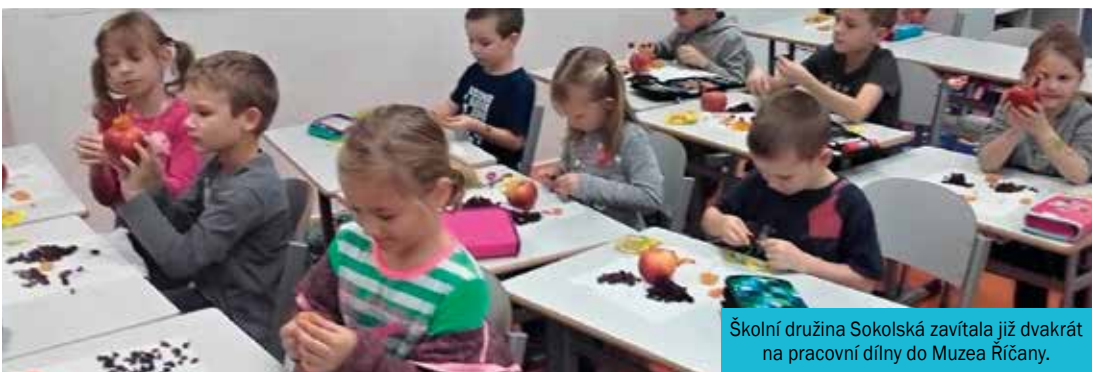
Školní družina Sokolská zavítala již dvakrát na pracovní dílny do Muzea Říčany.

Poznámky: • rozhodující je vždy trvalé bydliště dítěte • pokud má dítě trvalé bydliště jiné než zákonní zástupci, předloží zákonný zástupce u zápisu doklad z matriky, v němž je uveden trvalý pobyt dítěte