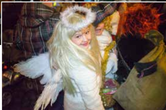
▲ Nechyběli ani andělé.

Město Říčany navázalo na oblíbenou tradiční čertovskou akci. Původní organizátor ji z technických důvodů nemohl realizovat. Pekelné mocnosti i nebeské bytosti zaplnily náměstí a užily si veselý večer jako obvykle.