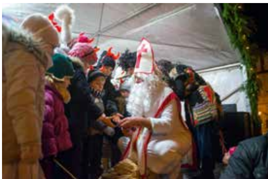
▲ V Mikulášově pytlí se našla odměna pro každého.