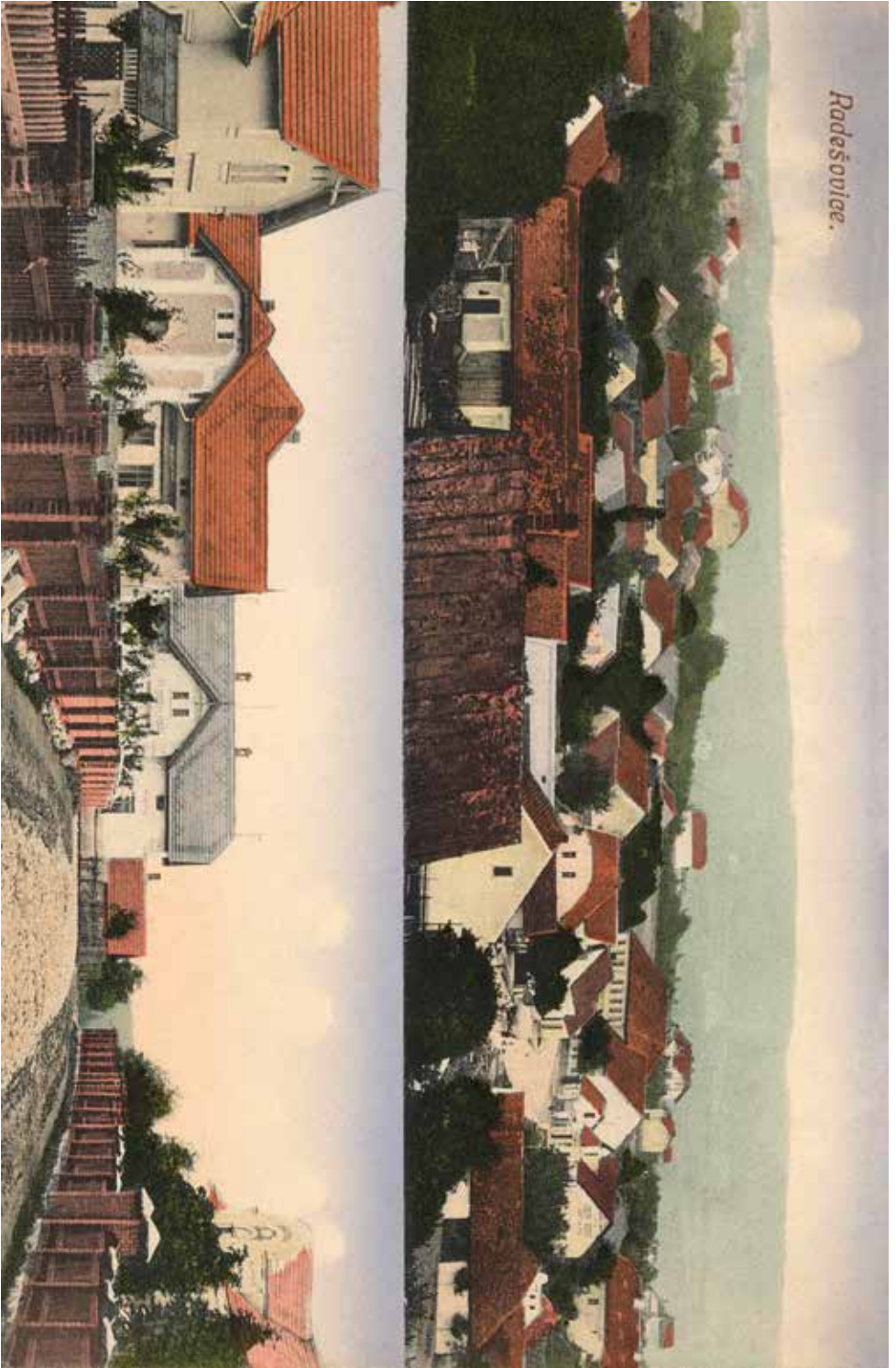
Prosíme návštěvníky historických fotografií (od konce 19. století do doby po listopadu 1989), o zapůjčení či darování muzeu. Zapůjčené fotografie budou po naskenování v pořádku vráceny majiteli. Přispějte tak k dokumentaci podoby města a okolí.