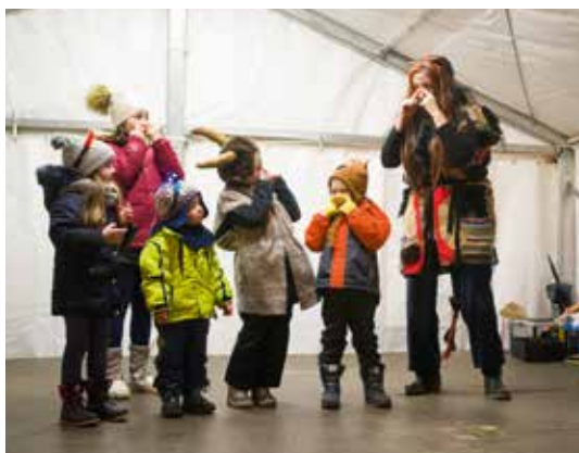
▲ Malé čertíky pobavila agentura Klauníci.