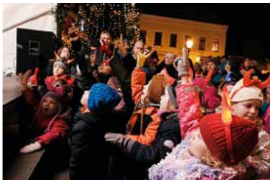
Dětské publikum bylo velmi aktivní