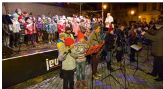
Na pódiu vystoupili žáci ze Základní umělecké školy Říčany, základní školy Bezručova a děti z mateřské školy Čtyřlístek.