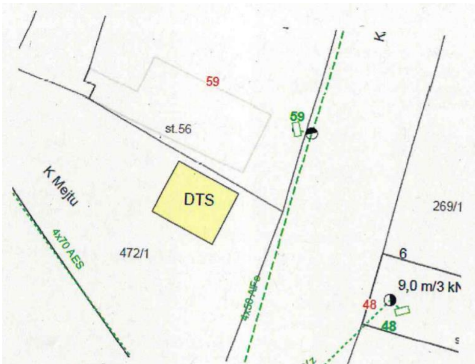
Obr. 1: Plánované umístění trafostanice.