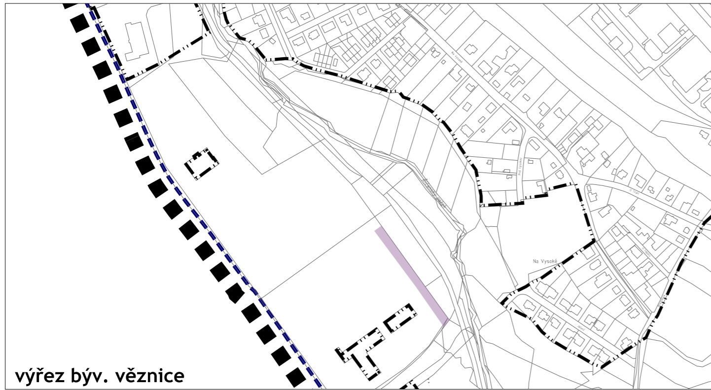
výřez býv. věznice