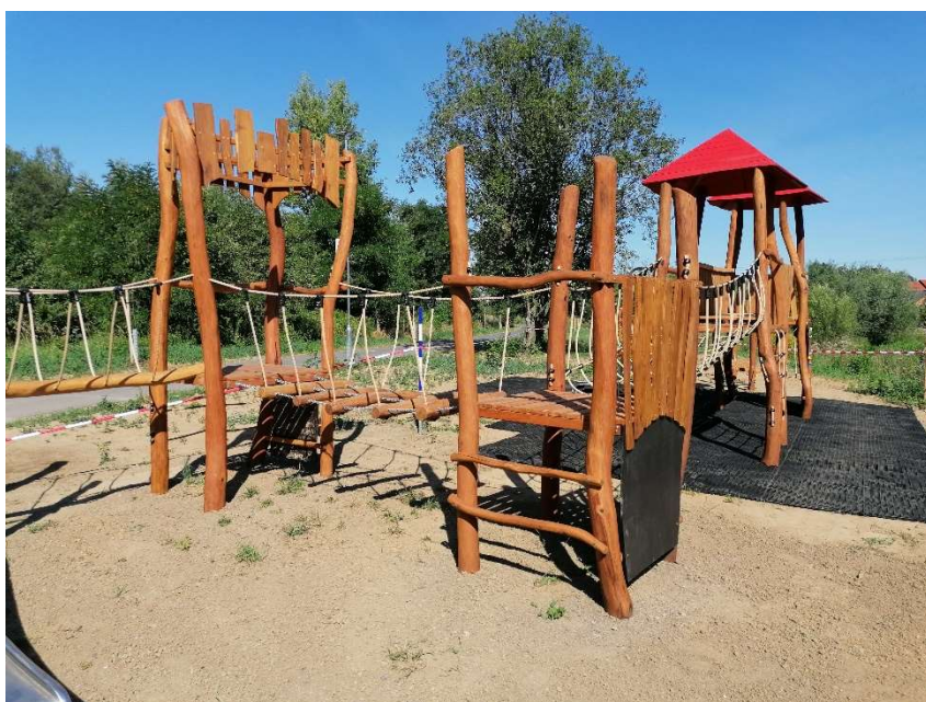
30.7.2020 Finální podoba herního prvku