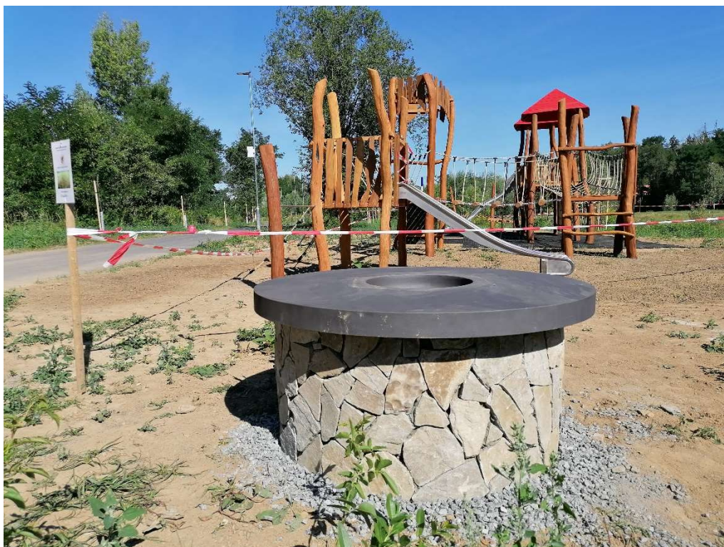
30.7.2020 Osazení griloviště