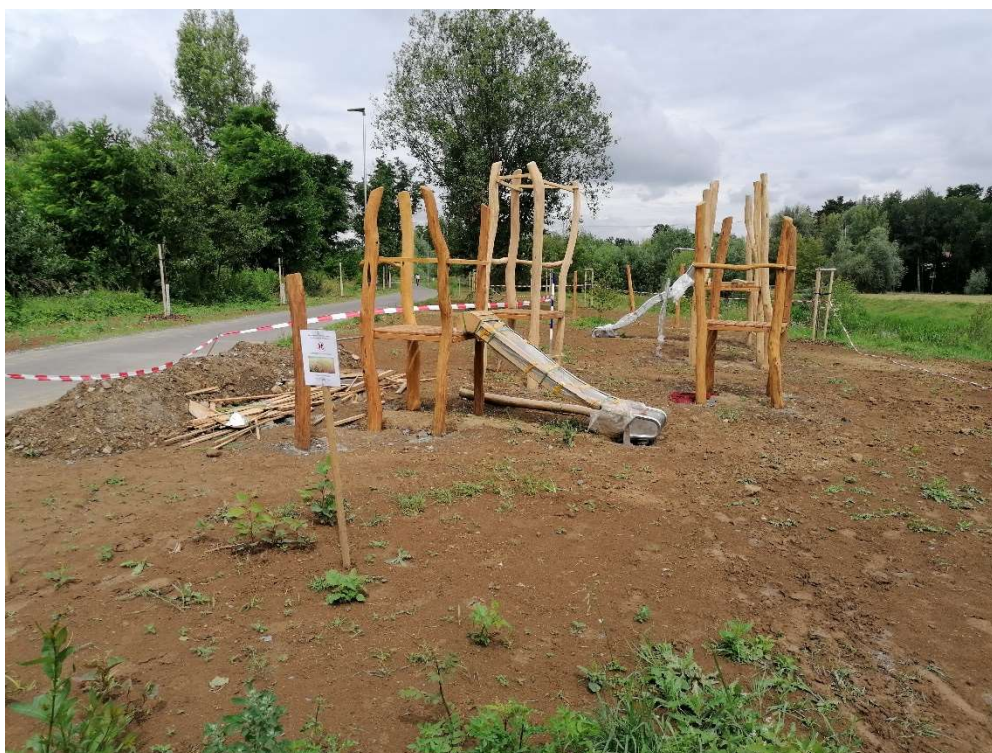
17.7.2020 Průběh realizace