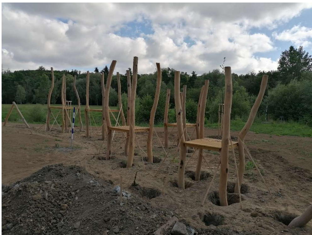
7.7.2020 Realizace herního prvku