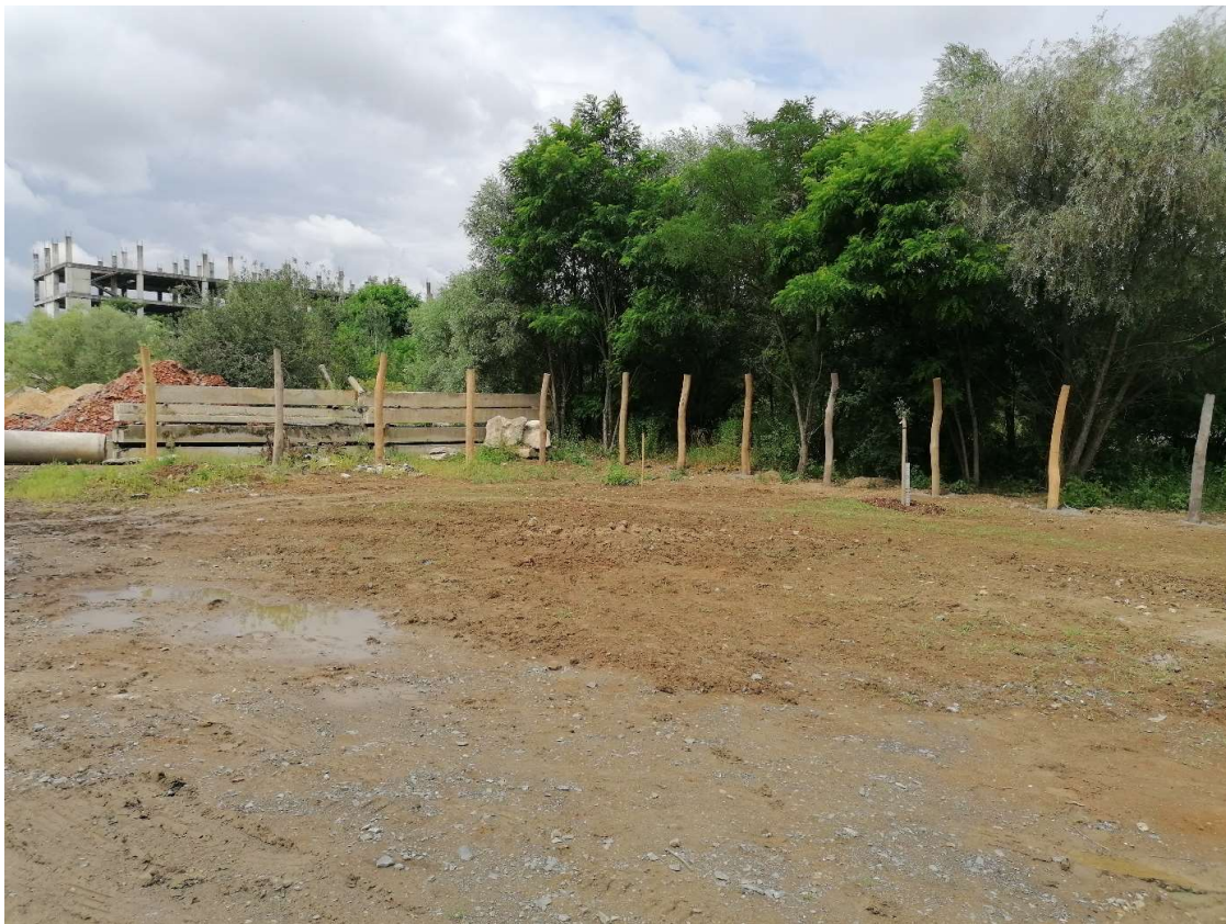
17.7.2020 Realizace palisádového plotu