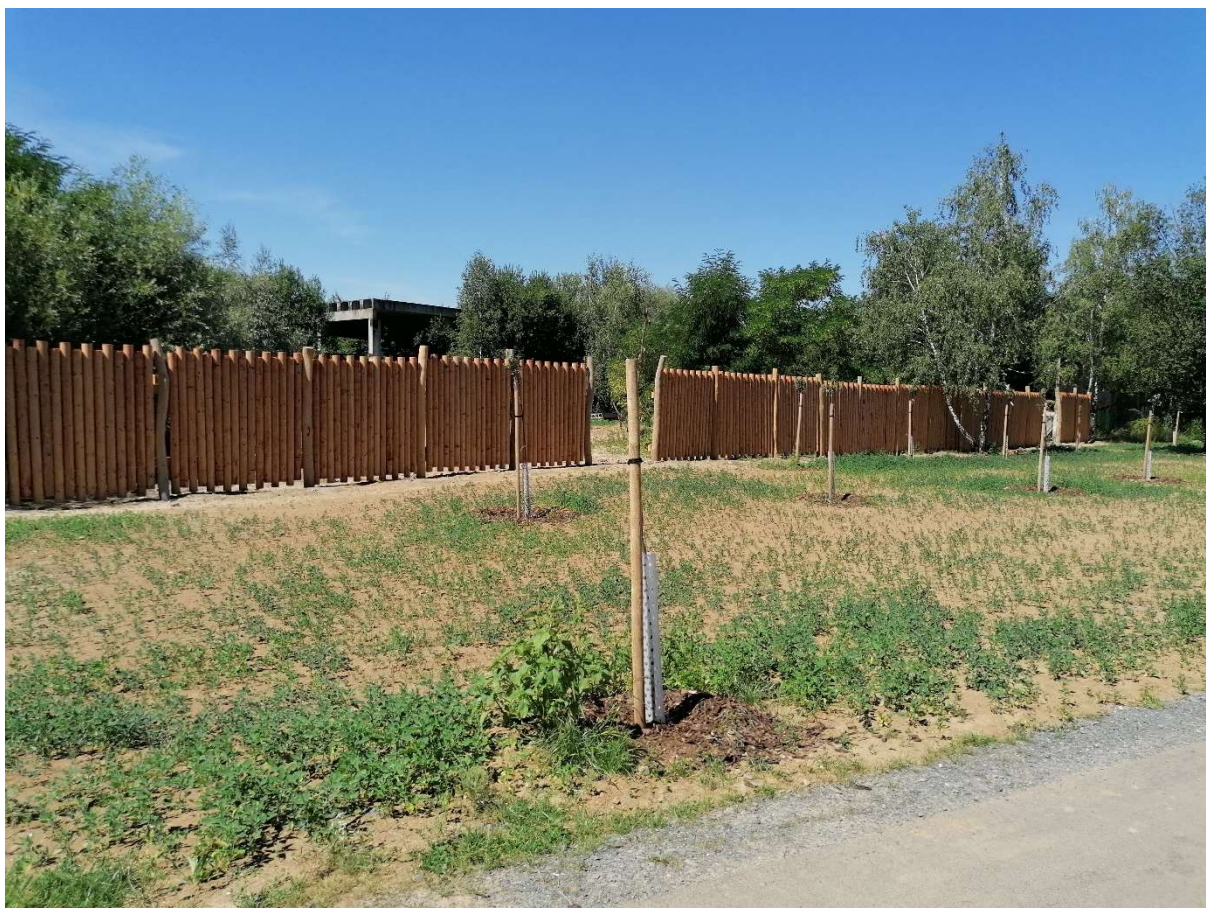
30.7.2020 Finální podoba palisádového plotu