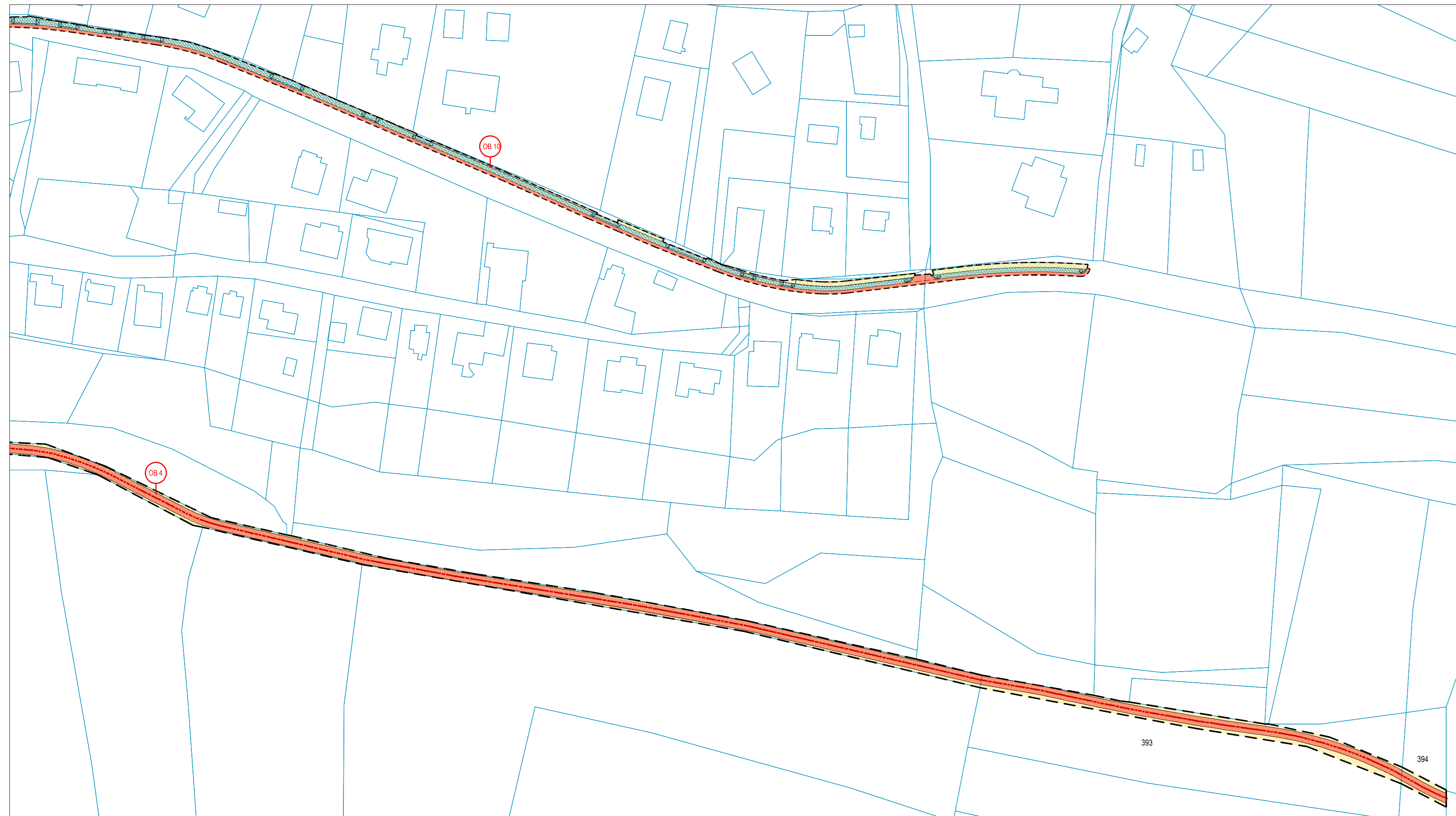
CELKOVÝ NÁHLED 1:5000