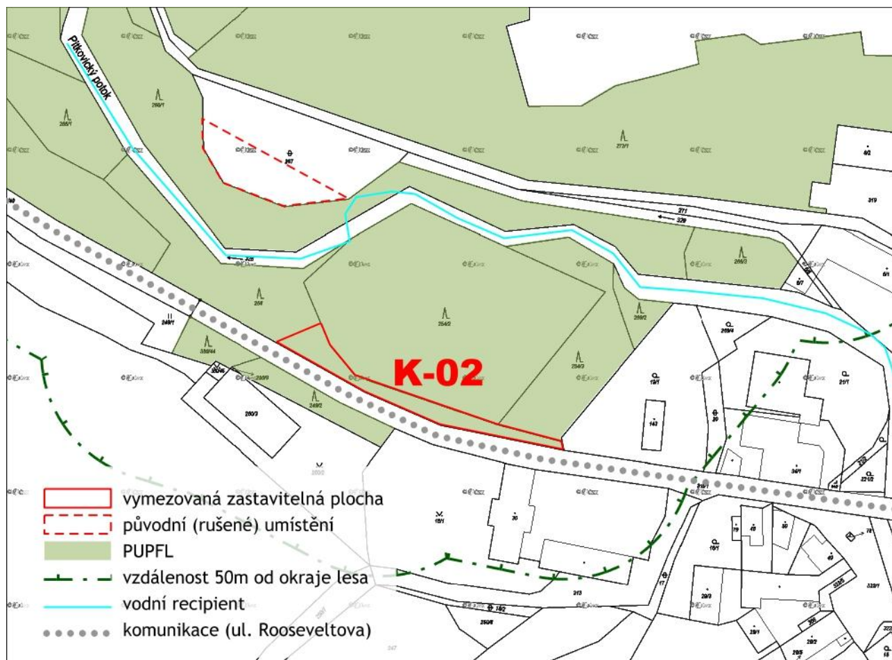
Obr. 3 Dotčení PUPFL

Původní pozemek parc. č. 267 v k.ú. Kuří u Říčan, určený stávajícím územním plánem Města Říčany pro výstavbu ČOV Kuří, je dlouhodobě majetkoprávně zablokovan pro možnou výstavbu této ČOV. Je zatížen řadami exekucí a velkým počtem spoluvlastníků. Tuto situaci se nepodařilo i přes veškerou snahu vyřešit a ani výhledově se možnost výstavby ČOV na tomto pozemku nejeví jako možná.