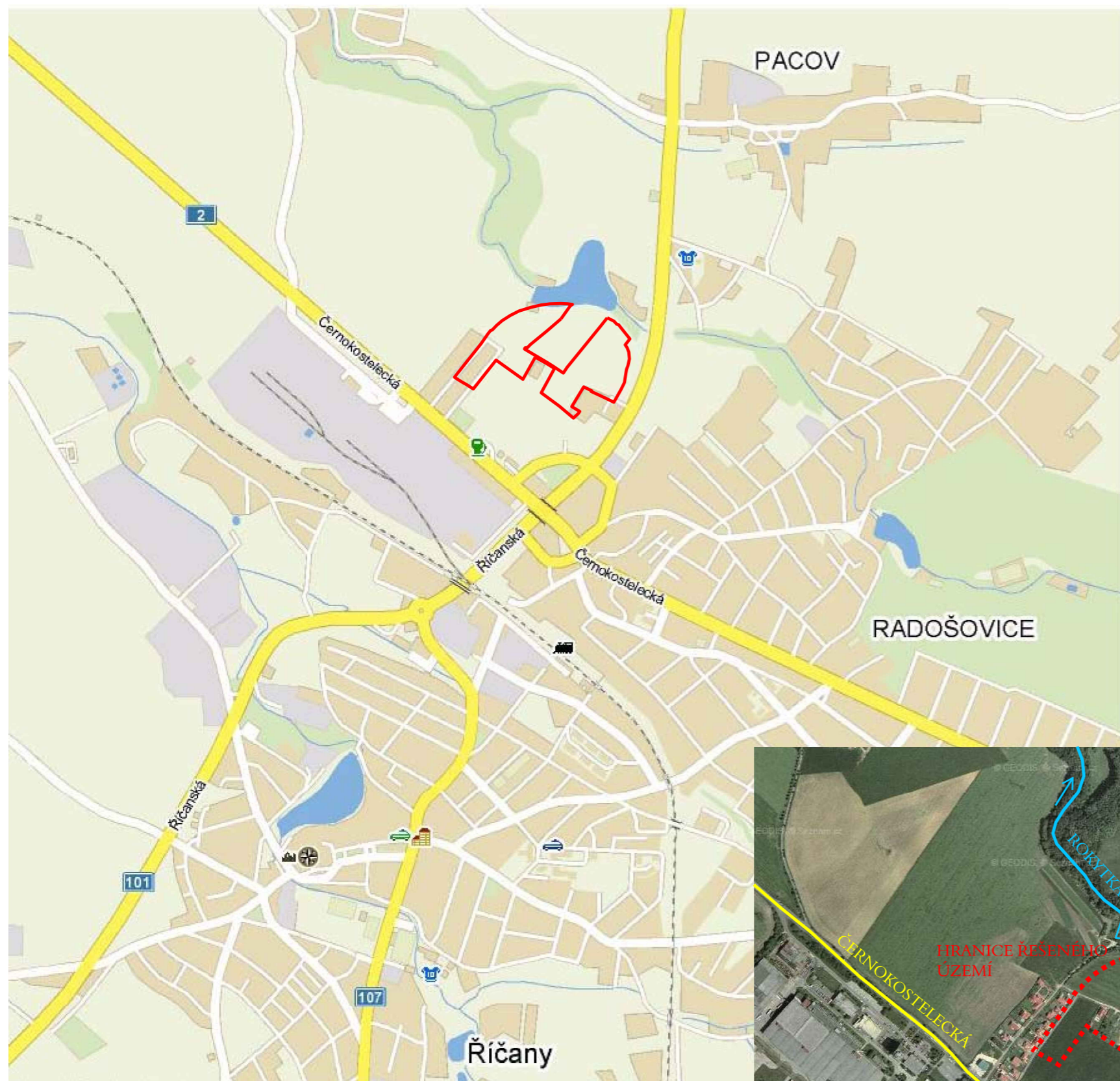
ZÁKRES ŘEŠENÉHO ÚZEMÍ DO VÝŘEZU MAPY ŘÍČAN A ORTOFOTOMAPY